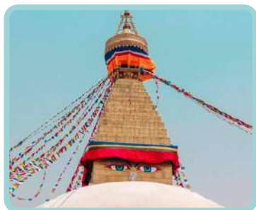
Nepal A Sabedoria do Precioso Mestre