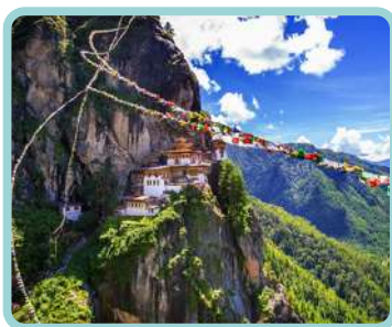
Butão No Misterioso Reino de Sangri-La