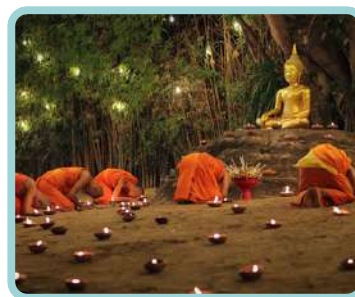
Tailândia Os Monges da Floresta