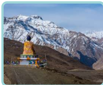
Vale Spiti - Himalaias