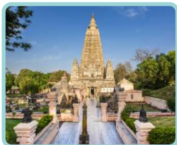
Peregrinação Budista Índia