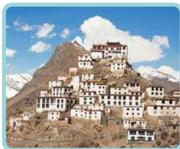
Himalaias Indianos Na Terra do Meio