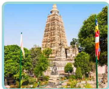
Índia e Nepal Pelo Caminho de Siddhartha