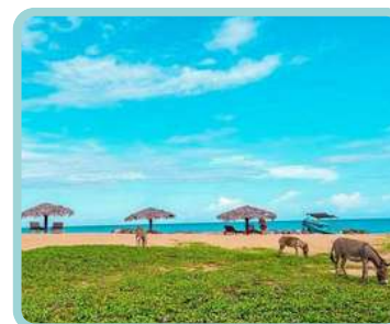
Sri Lanka Imersão Profunda na Natureza