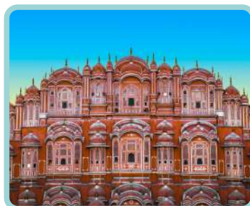
Rajastão + Ganges