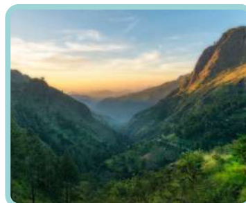
Sri Lanka + Maldivas