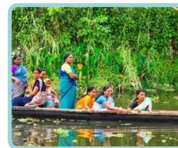
Índia Sul Natureza, Partilha Espiritualidade