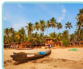
Goa + Kerala